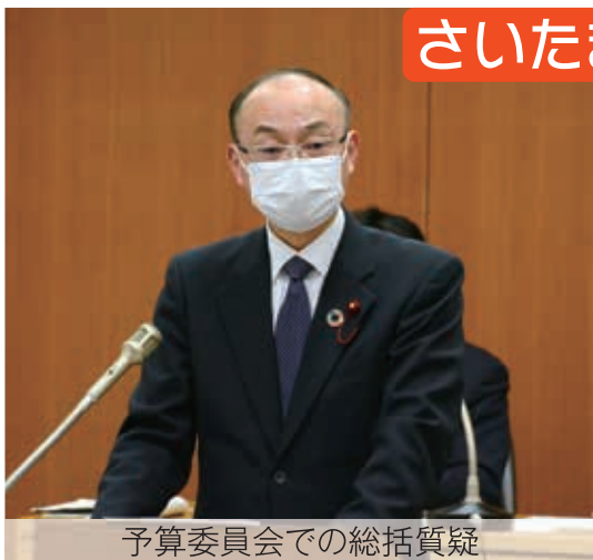
予算委員会での総括質疑

さいたま市議会令和3年2月定例会が2月2日～3月18日の45日間の会期で開催されました。後半の2月24日から3月15日にわたっては集中して予算委員会が行われ、令和3年度一般会計予算案等について会派を代表して総括質疑も行いました。