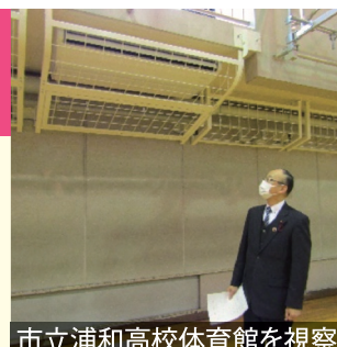
市立浦和高校体育館を視察

そこで、公明党市議団の提案で国に対し、「学校体育館への空調設備の設置に係る緊急防災・減災事業債の事業期間の延長を求める意見書」を提出し、財政措置の一層の拡充を求めました。