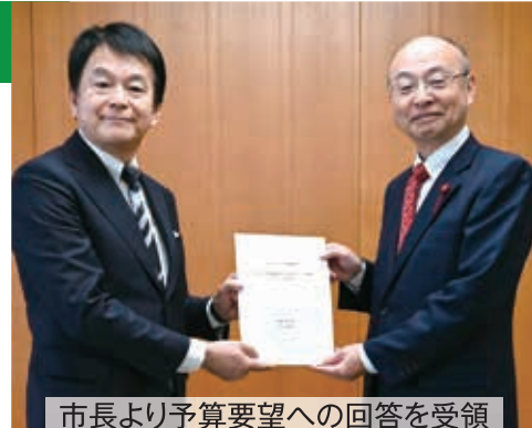
市長より予算要望への回答を受領

さいたま市議会 令和8年2月定例会が、2月3日～3月12日の38日間の会期で開催され、市長提出105議案、議員提出2議案を可決(第59号は修正の上可決)・承認・同意し、閉会しました。